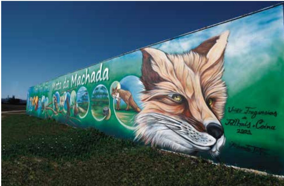
A obra que surpreendeu toda a população: o MURAL, na sede da junta de freguesia de Palhais, que representa o Rio Coina, o Sapal e a Mata da Machada

A União das Freguesias de Palhais e Coina continua o seu caminho sempre no sentido de trabalhar e dar melhores condições de vida a todos que escolheram a nossa Freguesia para viver. Continuamos a investir na valorização da prática desportiva, com a construção de mais um polidesportivo. Iniciámos e acompanhamos a obra do Polidesportivo de Palhais. Somos, sem dúvida, uma Freguesia que se preocupa com o desporto e a qualidade de vida das pessoas.