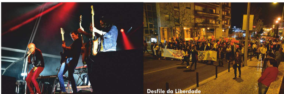
Desfile da Liberdade

Durante a manhã, decorreram os Hastear de Bandeiras nas oito freguesias do Concelho do Barreiro.