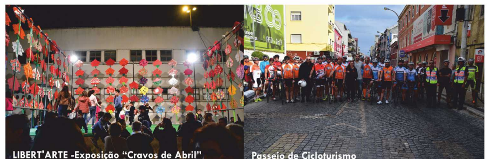
LIBERT'ARTE -Exposição “Cravos de Abril”